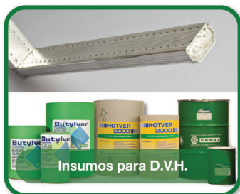
Insumos para D.V.H.

LÍDER EN PRODUCTOS QUÍMICOS PARA LA INDUSTRIA DEL VIDRIO PLANO PROCESADO.