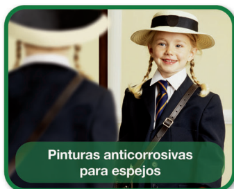
Pinturas anticorrosivas para espejos

www.fenzisouthamerica.com | fenzi@fenzisouthamerica.com