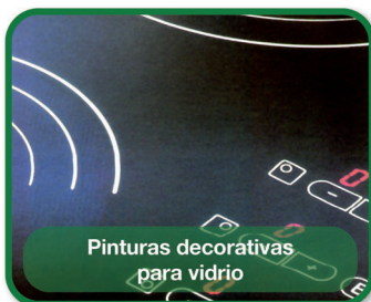
Pinturas decorativas para vidrio